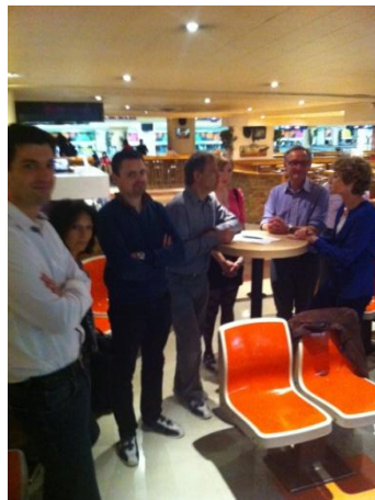
Discussions passionnantes sur les résultats